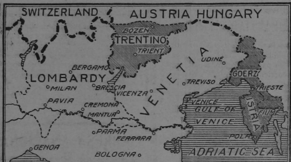
The heavily shaded portions of this map show the territory in Austria—the Trentino, Istria, Goerz—that Italy is disputing under force of its va ianti armies, and which once belonged to the Italian States. It shows too the location of Venice, one of the theatres of action of a Austrian and German submarines, and the specific city of that name over with disastrous effects.

MAP SHOWING THE TERRITORY DISPUTED BETWEEN AUSTRIA AND ITALY.